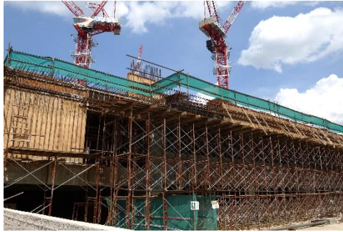
●Astaka: 1階部分建築中、枠組開始